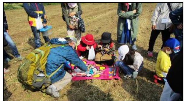
竹トンボに色ぬりしました