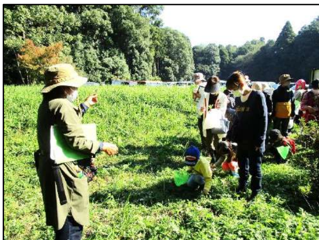
野草会の案内で 草や木の観察が始まりました