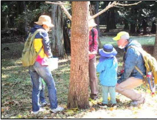
カナヘビやクワガタを捕まえて大喜び