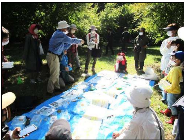
観察しながら 勉強会です