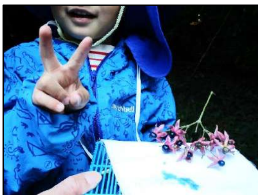
クサギの藍色の実をつぶして布につけてみる