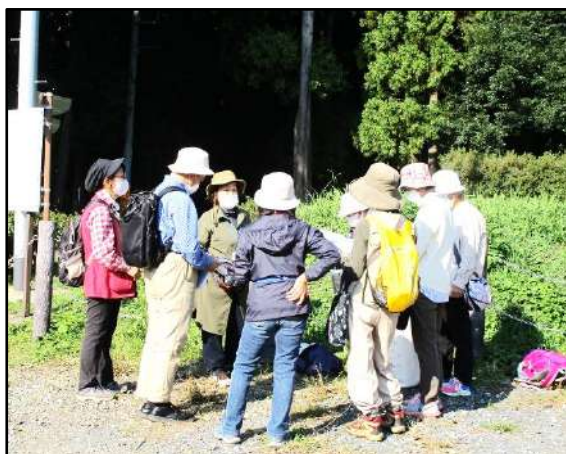
野草会の皆さんの事前に念入りな下準備です