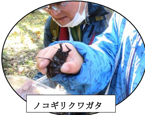
ノコギリクワガタ