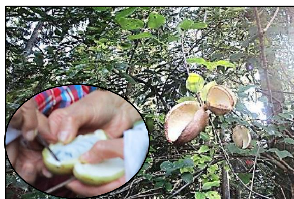
アケビの中の白い果肉を食べてみました