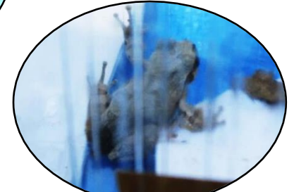
日本アマガエル 体の色を保護色に変える