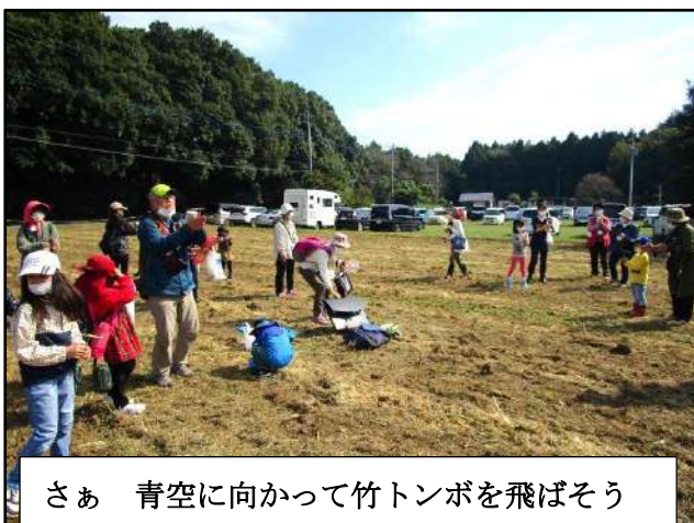
さあ 青空に向かって竹トンボを飛ばそう