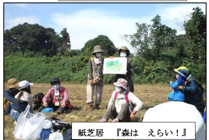
紙芝居 『森は えらい!』