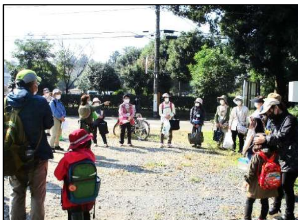
野草会の会長さんよりご挨拶、自己紹介